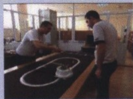
Faculté Génie électrique et l'Association d'étudiants OSSPEC

Objectifs : Former des professionnels de haut niveau associant des compétences dans l'exercice artistique du métier d'acteur à une connaissance approfondie de la culture et de la création théâtrales européennes.